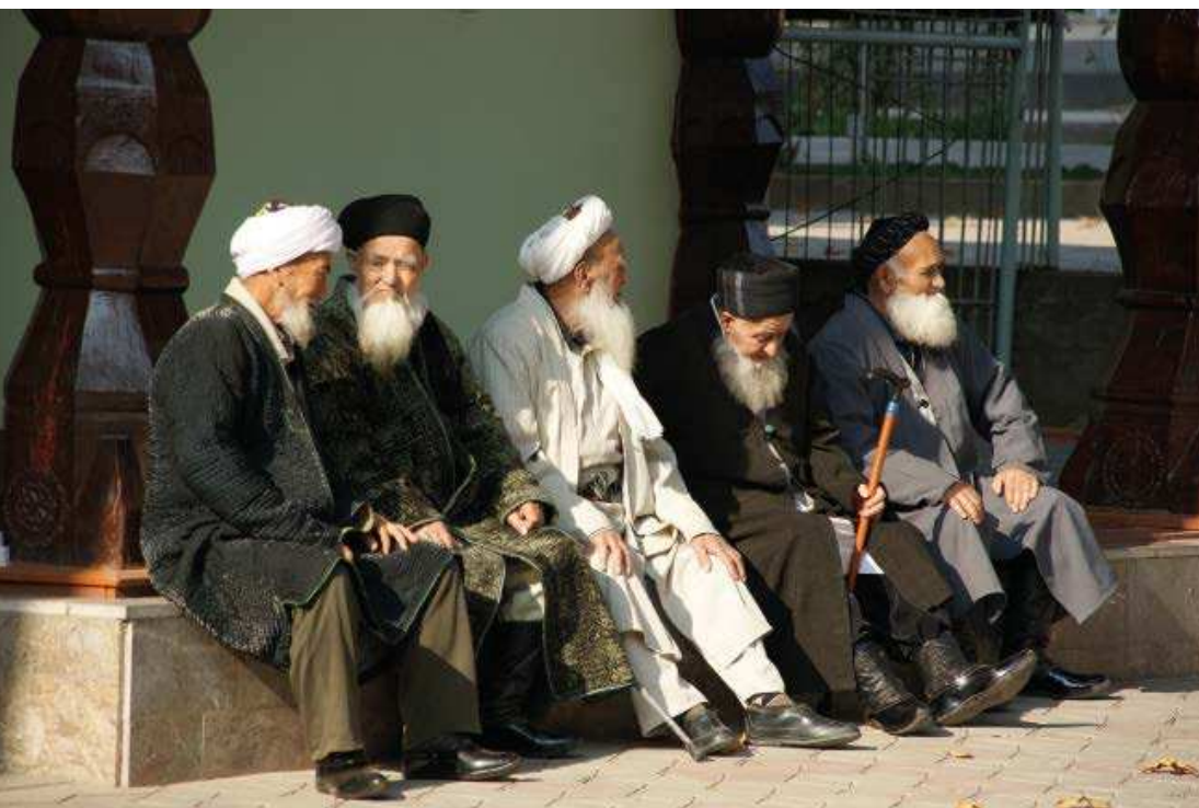
Wierni przed meczetem Maulana Jakuba Czarchi w Duszanbe